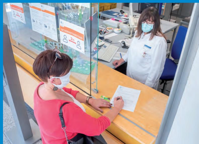
Anmeldung an der Ambulanz. Nach dem Besuch der Klinik verlassen Patienten die Medizinische Klinik durch einen separaten Eingang, um den Kontakt zwischen Personen zu reduzieren.