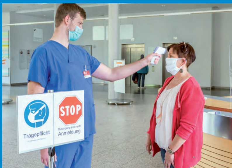
An den Eingangspforten wird Fieber gemessen.

„Ein Zeichen der Anerkennung für den Pflegeberuf!“